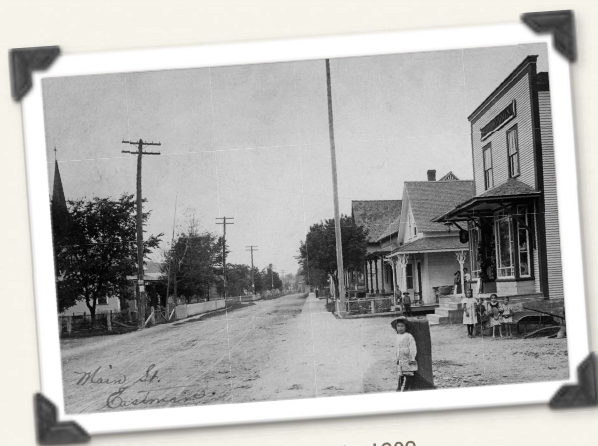
rue Principale, 1909