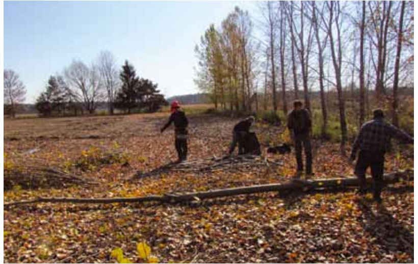
Une fois la période des récoltes terminée, la coupe des peupliers s'effectue facilement

Présentement, la réglementation interdit la récolte d'arbres en bordure des cours d'eau situés en milieu agricole, mais seulement dans les 3 premiers mètres au-dessus de la ligne des hautes eaux. Ainsi, dans une bande riveraine de 10 m de largeur, la récolte serait possible dans les 7 mètres situés côté champ. Soulignons que de l'aide financière est disponible pour les agriculteurs désireux d'implanter une bande riveraine arborescente élargie (5 à 10 m de largeur), par le biais du programme Prime-vert du MAPAQ. Ce programme couvre 70 % des coûts liés à l'établissement d'une bande riveraine.