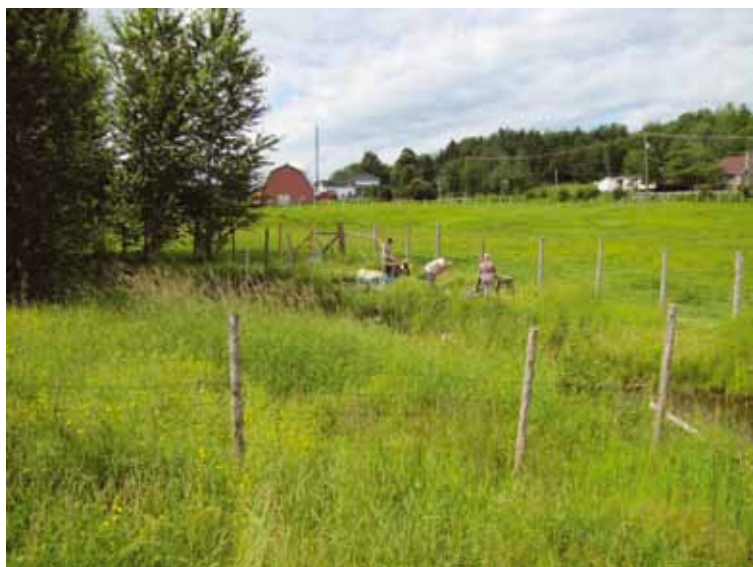
Échantillonnage d'une bande riveraine herbacée située à côté d'une bande de peuplier (Magog)