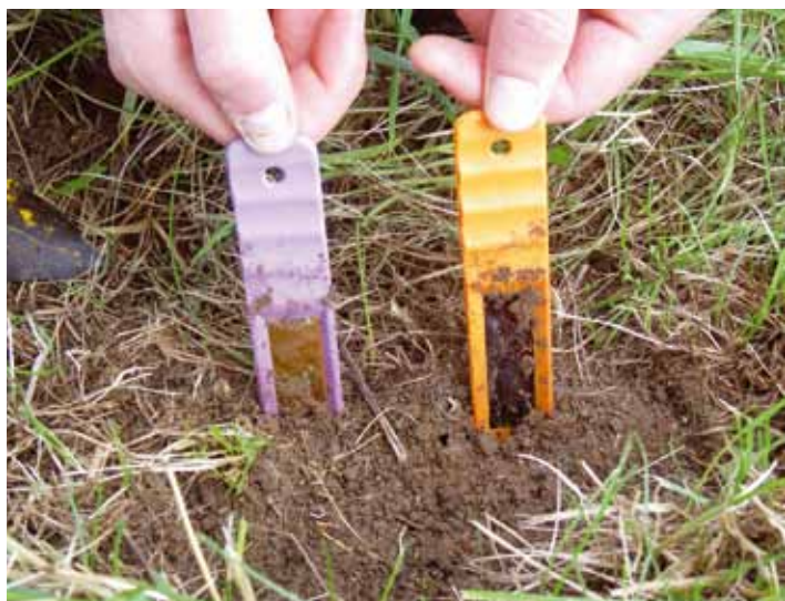
Résines échangeuses d'ions utilisées pour mesurer le flux de nitrate et de phosphore dans les sols riverains.

Lors de notre étude, nous avons également mesuré les flux de nitrate et de phosphore sous la surface du sol dans les bandes de peuplier et dans les bandes herbacées. Pour ce faire, nous avons inséré des résines échangeuses d'ions (PRS-probes™) dans le sol pour une durée de 20 jours au cours de l'été 2011. Ces résines échangeuses d'ions se comportent un peu comme une racine, donc plus il y a de nutriments dans le sol, plus elles en captent à leur surface.