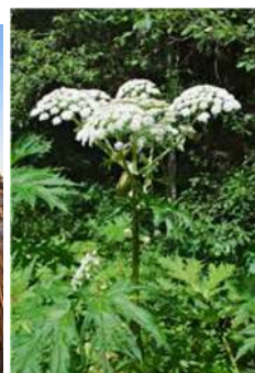
Berce du Caucase