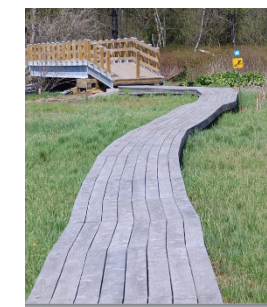
rue des Pins Sud...

Les sentiers du parc Missisquoi-Nord sont tout désignés. Pourquoi ne pas s'offrir une heure de randonnée pédestre dans ce parc municipal ? Des sentiers bien balisés; en famille, seuls ou en groupe; des dénivelés modestes mais exigeants; un environnement forestier diversifié, un parc municipal accessible par la