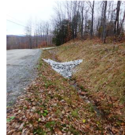
Exemple de seuil

L'un des moyens les plus efficaces pour réduire les débits est d'aménager divers ouvrages dans les fossés : seuils, trappes à sédiment, fosses de dissipation, enrochements ou bassins de rétention.