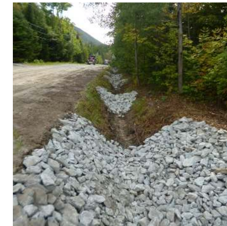
Seuils sur le chemin de l'Hirondelle

D'autres aménagements de fossés sont prévus en 2017 dans le secteur du lac Orford. Soulignons que ces travaux s'inscrivent dans un esprit de développement durable et sont le fruit d'un travail d'équipe entre les divers services municipaux (voirie et environnement, notamment) et les associations de bassins versants, pour l'identification des secteurs problématiques.