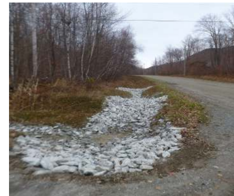
Seuils et enrochement sur le chemin des Étoiles

Depuis quelques années, la municipalité réalise chaque année ce type d'aménagements dans les fossés municipaux afin d'atteindre ses objectifs de protection de l'environnement, suite aux recommandations du comité consultatif en environnement. En 2015, les fossés des chemins du Hibou, du Cèdre et de la Source ont ainsi été aménagés dans le secteur du lac Stukely, de même que sur le chemin Mont-Bon-Plaisir dans le bassin versant du lac Parker et le chemin des Diligences dans celui du lac d'Argent. Cette année, la municipalité a aménagé les fossés de la rue des Tourterelles dans le secteur du lac Stukely et plus récemment, en novembre dernier, plusieurs fossés de rues municipales dans le secteur du Vertendre , dans le sous-bassin du ruisseau Bonnallie (alimentant le lac d'Argent).