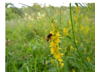
Le mélilot jaune

D'autres fleurs et plantes attirent des insectes intéressants ou en péril telles l'asclépiade pour le papillon monarque, par exemple.